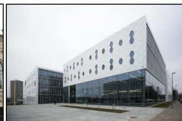
Nacionalinis fizinių ir technologijos mokslų centras